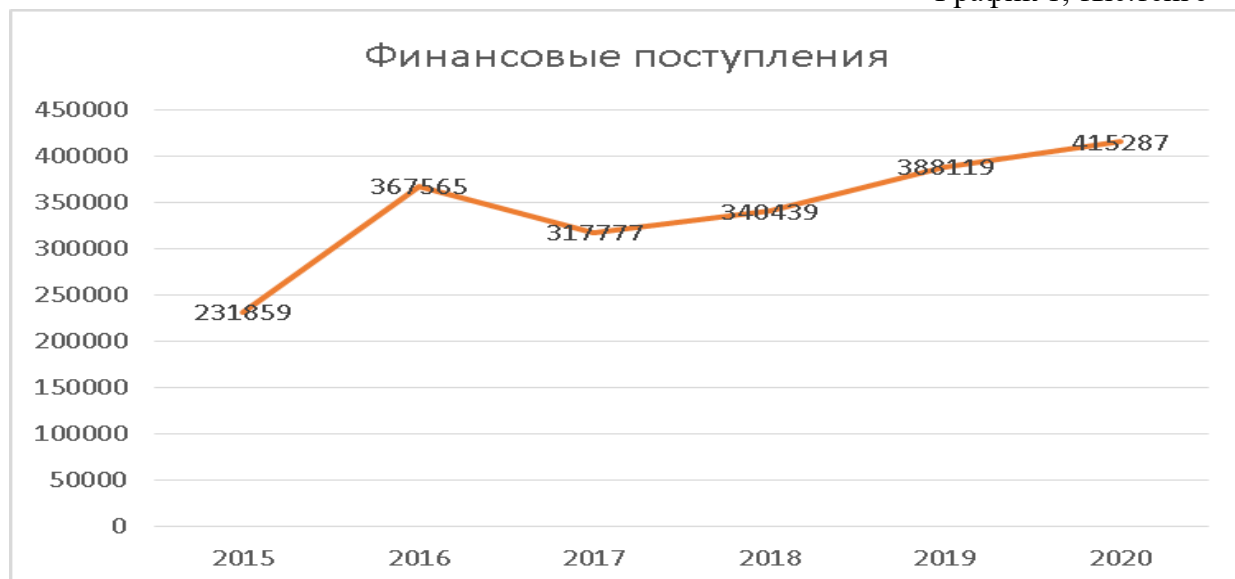
График 1, тыс.тенге

Как видно на графике динамика финансовых поступлений за период 2015-2020 годы положительная, что свидетельствует о стабильном поступлении денежных средств.