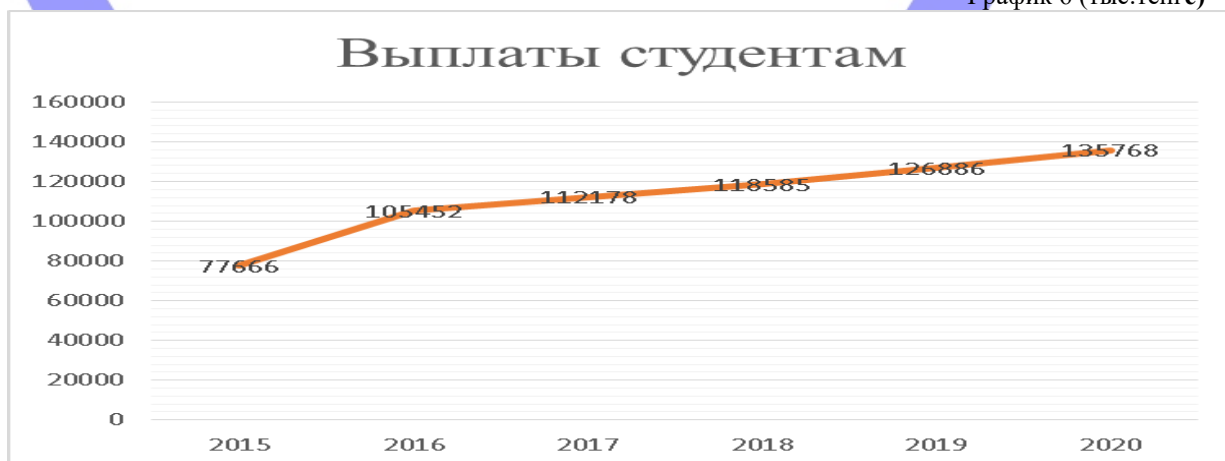
График 6 (тыс.тенге)

Как видно на графике динамика расходов на выплаты студентам имеет положительную динамику, так как коррелируется с финансовыми поступлениями.